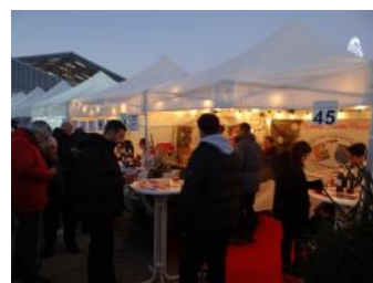
Du monde à notre stand

A notre grande satisfaction, de nombreux gourmets se sont arrêtés à notre stand.