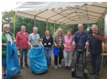
Nettoyage obligatoire le lendemain

Chose remarquable, en quelques heures, le jumelage a accueilli plus de 200 personnes ! Pour nos partenaires de Naurod, la prochaine participation sera le 26 août 2024.