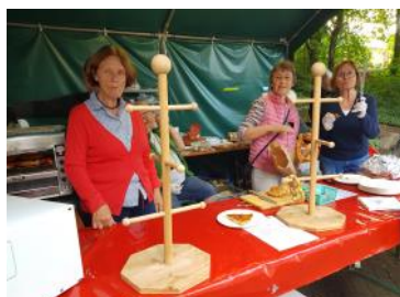
Un stand qui semble avoir été dévalisé!

dégustations de vin ou autres boissons et vend de quoi se restaurer. Bien évidemment, nos amis du jumelage Naurod-Fondettes participent activement à ce rendez-vous annuel. En 2023, leur participation était le 1 er septembre. Ils proposaient du Vouvray, du Touraine rosé pétillant, du Chinon ainsi que des vins blancs locaux. Pour se sustenter, il était proposé des quiches Lorraines, des petits-pains avec du Fleischkäse (pain de viande) et des Bretzels avec du «Spundekäs», une spécialité de la région préparée avec du fromage blanc, du beurre et autres ingrédients dont chaque famille garde le secret.