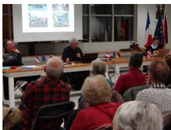
Un auditoire attentif