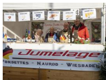
Prêts à accueillir les gourmets

Comme tous les ans, notre jumelage animait un stand au marché de Noël organisé par la mairie de Fondettes. Traditionnellement, nous faisons découvrir aux Fondettois des spécialités d'Allemagne. Cette