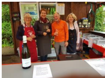
Dégustation lors d'un moment de repos

La « Nauroder Sommerlaune », qui peut se traduire par « ambiance estivale de Naurod » est une manifestation qui concerne les associations. De fin mai à fin septembre, chaque vendredi de 17h à 22h, une association (différente chaque vendredi) organise des