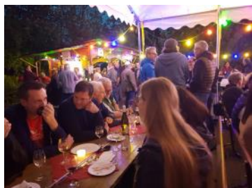
Plus de 200 personnes !

dégustations de vin ou autres boissons et vend de quoi se restaurer. Bien évidemment, nos amis du jumelage Naurod-Fondettes participent activement à ce rendez-vous annuel. En 2023, leur participation était le 1 er septembre. Ils proposaient du Vouvray, du Touraine rosé pétillant, du Chinon ainsi que des vins blancs locaux. Pour se sustenter, il était proposé des quiches Lorraines, des petits-pains avec du Fleischkäse (pain de viande) et des Bretzels avec du «Spundekäs», une spécialité de la région préparée avec du fromage blanc, du beurre et autres ingrédients dont chaque famille garde le secret.