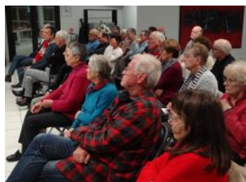
Les adhérents du jumelage